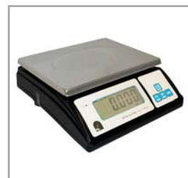
Balanza solo peso