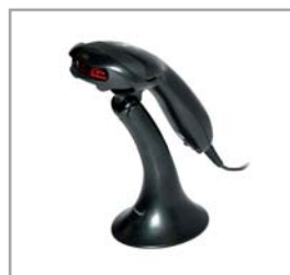
Lector código de barras