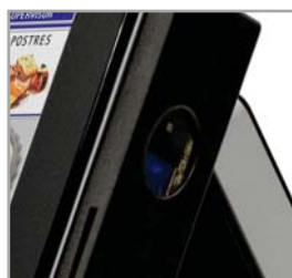
Lector biométrico y lector de banda magnética