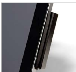
Lector de banda magnética