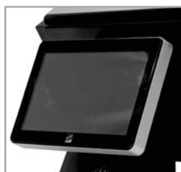
Segunda Pantalla de 10.1"